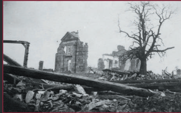
Les ruines de l'église et le marronnier

C'est le temps pour les pionniers et sapeurs de s'enterrer et de creuser des kilomètres de galeries, de chambres d'abris, d'où partiront les rameaux de combats qui, infiltrant le réseau ennemi, permettront à coups de tonnes d'explosifs de lui infliger le plus de pertes possibles.