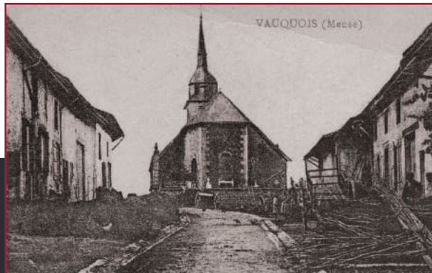
Le village de Vauquois avant la guerre

A la mi-mars, le front de la Xe Division du Général Valdant est enfin stabilisé dans la moitié Sud du village. Ses positions, mieux protégées, lui permettent de résister à une contre-attaque alliant aux armes classiques un engin nouveau et terrifiant : le lance-flamme. La guerre de position s'est installée dans le secteur.